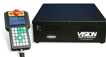
Kontrolenheden for 1624, 4. Generation med løst LCD display, for visning og justering af hastigheder m.m.