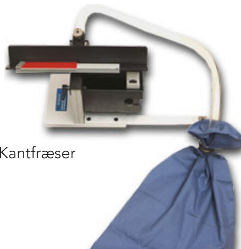
Varga 2 Kantfræser