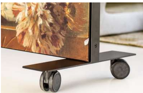
Fodplader med og uden hjul