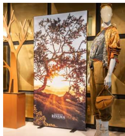
Fritstående dobbeltsidet profil