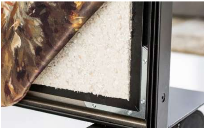
Ramme med støjdemningsmateriale monteret